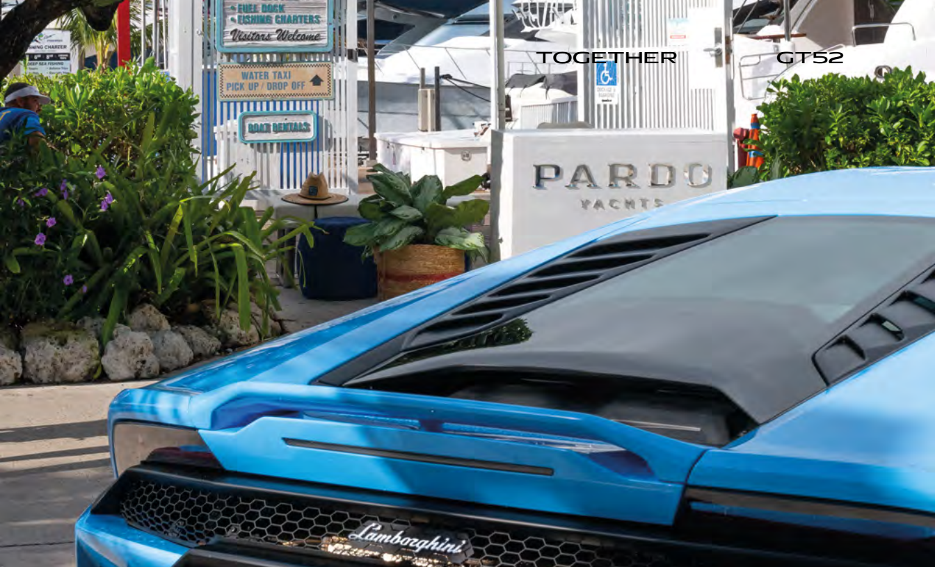
MIAMI - PARDO YACHTS & LAMBORGHINI