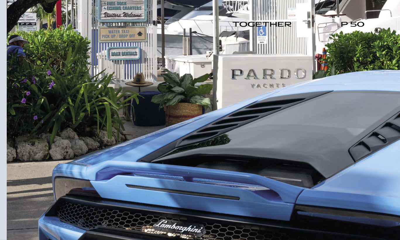
MIAMI - PARDO YACHTS & LAMBORGHINI